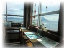
開聞岳を望む休憩コーナー

タツノオトシゴは漢方薬や薬膳料理の原料、また観賞魚用途や飾り物用として、多くの野生個体が東南アジアを中心に漁獲され輸出されています。この結果、乱獲により絶滅が危惧され、ワシントン条約にもリストアップされました。タツノオトシゴハウスでは、自然との調和を心がけた養殖を行いその生態の魅力とともに養殖の意義を皆様にお伝えしたいと思っています。