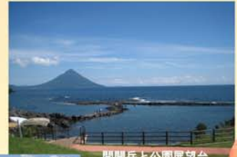
開聞岳と公園展望台