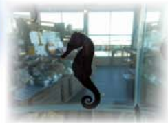
近海にも生息するクロウミウマ

海中をゆったり泳ぐタツノオトシゴ。ユニークなネーミングと容姿から誰もが知っている生き物でありながら、ヨウジウオ科に属する魚の仲間であることはあまり知られていません。日本では形態が「竜」の子供を想像させることから「竜の落とし子」と呼ばれていますが、中国語では海馬（かいば）、英語ではシーホース（SEA HORSE）と呼ばれ、よく馬に連想されるようです。しかし他の魚と同じようにエラや背ビレ、胸ビレを確認することができ、やっぱり魚！と納得です。