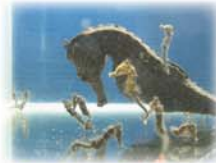
タツノオトシゴの赤ちゃん