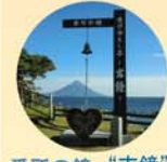
番所の鐘 “吉鐘” 幸運・健康・縁結び 子宝・安産を祈願