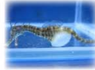
ポットベリーシーホース